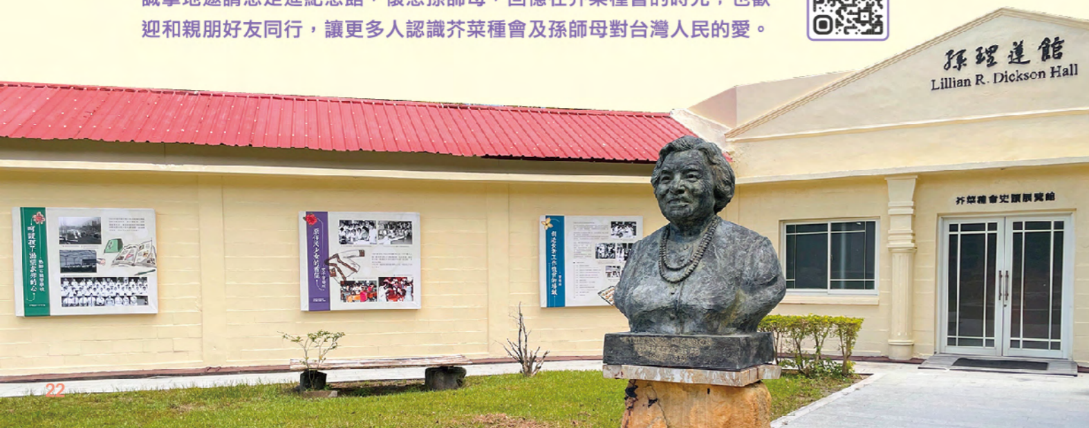
孫理蓮館 Lillian R. Dickson Hall