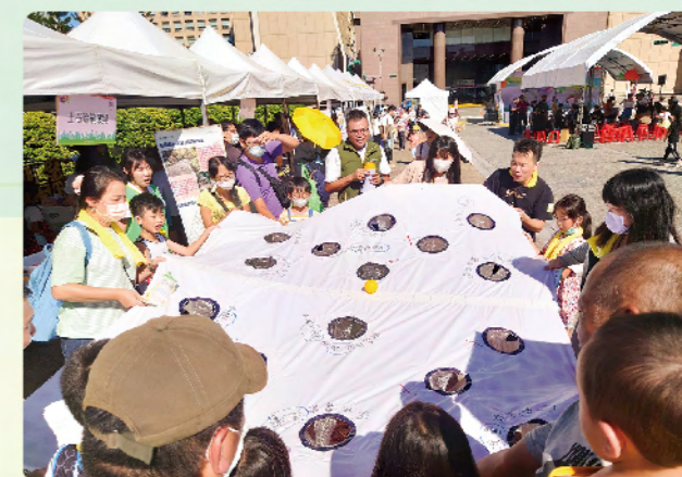
認養人帶著小朋友一齊參加青銀共創健身房關卡