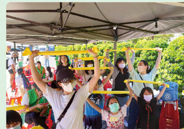
認養人與認養童齊心協力闖關

感謝認養人愛的付出，與我們共同用助人的方式傳遞上帝的愛，不僅透過認養服務幫助有需要的孩子，也以實際行動參與支持芥菜種會防救災培力宣導，藉由防災挑戰遊戲，認養人與孩子們共同學習防災觀念，保護自己也保護家人，建立社區助人網絡，打造韌性安全城市，達到「共生」的永續目標。 NSM