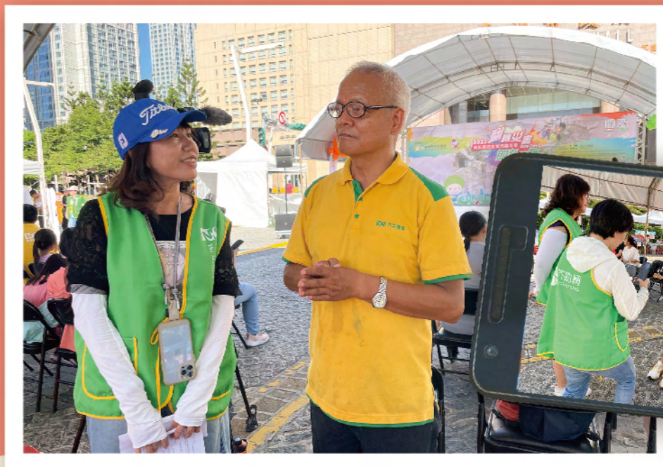
▲ 熟齡網紅班學員街頭採訪

在街頭採訪方面，我們的網紅班學員向民眾提問了一些與防災相關的問題，例如學校和社區應該如何提高防災意識，以及他們對防災包的了解和應對地震的行動計劃。這些採訪不僅讓學員們聆聽了民眾的看法，還能向他們提供正確的防災知識。