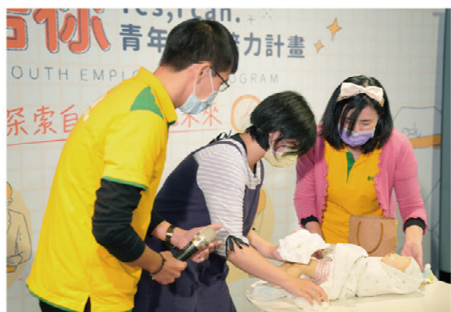
上/「50+不凋花培力班」學習擔任社區講師或在市集銷售作品 下/青年就業培力計畫藉由實際操作及職場觀摩體驗，進行個別化輔導及媒合就業