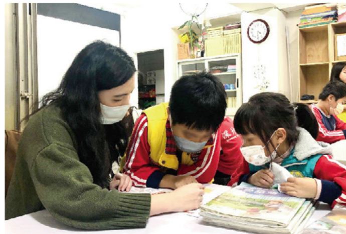
以樂家園陪伴家庭失能的孩子 在學習自立的過程中不孤單

在孩子來到家園後，我們看見少年們都有了方向，他們或者是年滿18歲需離院自立，或者是高中畢業要到外地就學，但基於原生家庭功能未恢復或是根本沒有家可以回，當結案之後，缺少了原本支持和保護的機構或家園後，獨立生活成為孩子一個艱難的挑戰。