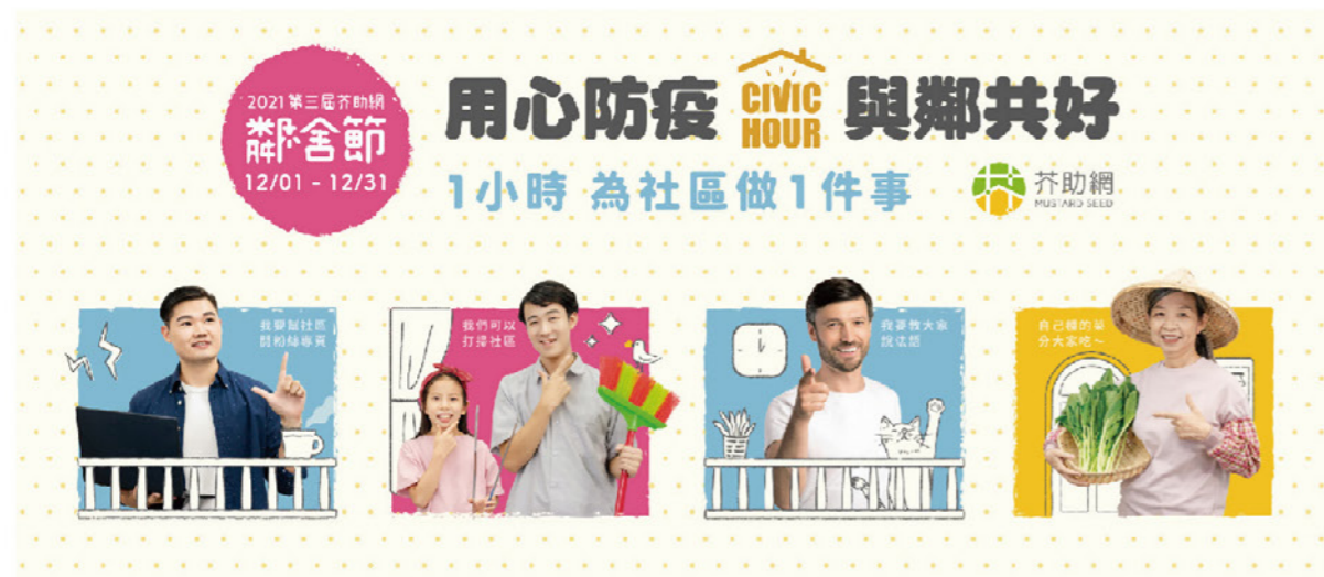
2021年鄰舍節主題-用心防疫 與鄰共好

芥菜種會在台服務已70年，長期照顧弱勢族群，深感現代鄰舍間越來越冷漠疏遠，造成許多社會問題，期待透過建構社區互助網絡「芥助網」，讓社區成為一個互助的共同體。「鄰舍節」起源於1990年的法國，原意為「樓房的節慶」，是一個讓鄰居見面打招呼、互相認識、歡慶的節日，起源於當時有一位獨居老婦人在家中過世，卻足足兩個月後才被鄰居發現，此事震撼當地，於是開始舉辦活動，希望能打破都市中的冷漠與孤單，共同建立起社區中的情感互助網絡。2021年，芥助網鄰舍節正式取得法國國際鄰舍節總會的認可，致力推行愛鄰舍的理念。