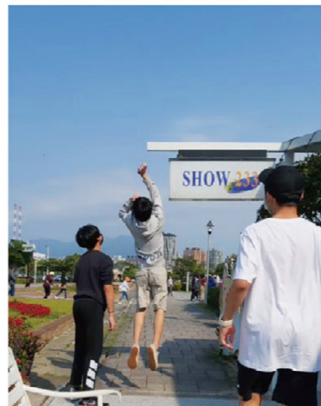
戴著口罩在戶外活動的培心家園少年

2022年是芥菜種會邁入緊急短期安置服務的第10年，我們也將秉持「創傷知情」觀點，看待創傷兒少的獨特性，重新調整狀態、儲備能量，讓預定的各項服務和工作計畫能順利進行。