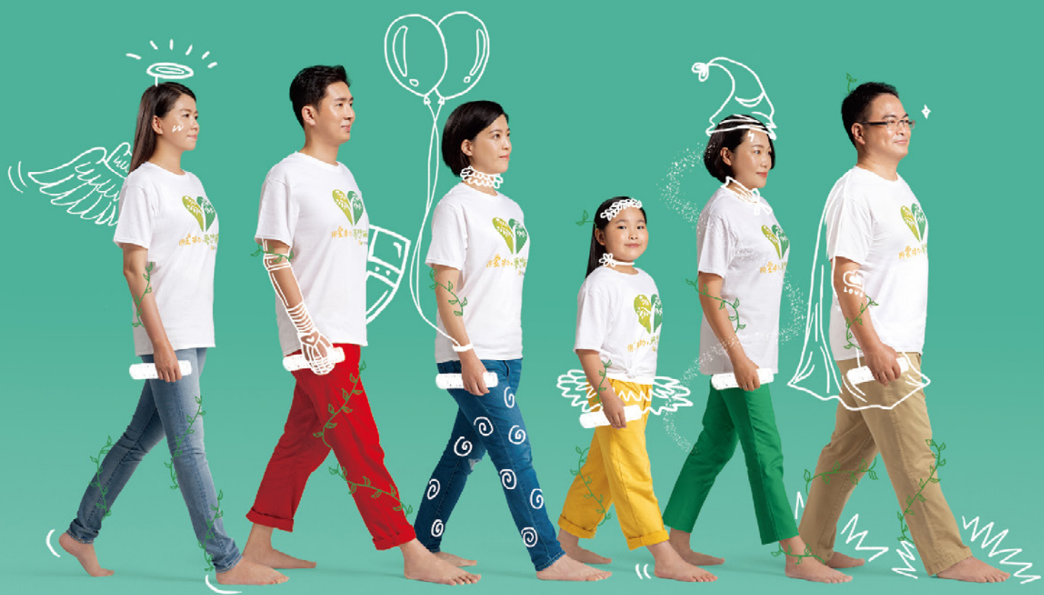
黃小姐 資訊業 / 認養資歷2年