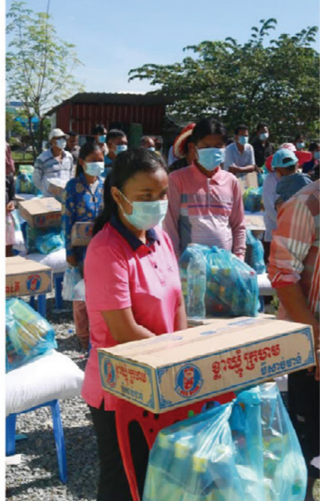
右/疫情期間發送食物包