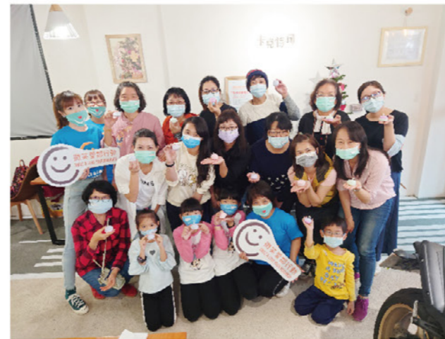
左/芥助網鄰舍節活動串聯全台灣愛心店家，一同響應 右/新北市蘆洲區仁義里舉辦巷弄牆面美化活動

去年因為新冠疫情的侵襲，改變了人們的生活方式，新型變種株的出現，也使大家墮入在生活可能再次封閉的陰影中，然而冷漠比病毒還可怕，因此我們以「用心防疫 與鄰共好」為主題，強調只要作好防疫，仍可與鄰互動；並進行「社區幸福力大調查」，從調查結果可見當社區居民開始進行社交行為與互助時，對社區的評價及幸福感都會提升，正呼應了我們舉辦鄰舍節的目的——拉近社區居民間的距離，進而培養社區凝聚力，除了協助弱勢脫離困境，更要喚起其他民眾一起為社區付出、做出改變，讓社區共榮發展。