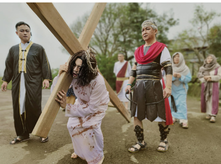
在孫理蓮紀念營地—聖經文化園區感受獨特而豐盛的復活節體驗

芥菜種會所屬的社會企業，位於萬里的「孫理蓮紀念營地」昔日曾是讓弱勢兒少重展歡顏的夏令營地；位於花蓮的「習藝所」，則是培育原住民孩子習得一技之長、翻轉生命的技職學校。而今，兩營地秉持著創辦人孫理蓮宣教士「要為主多多使用」的社會服務使命，逐步轉型，讓更多人在此得到生命更新與療癒，同時兩營地的盈餘皆投入芥菜種會社區工作、兒少安置及國外貧童認養等服務。