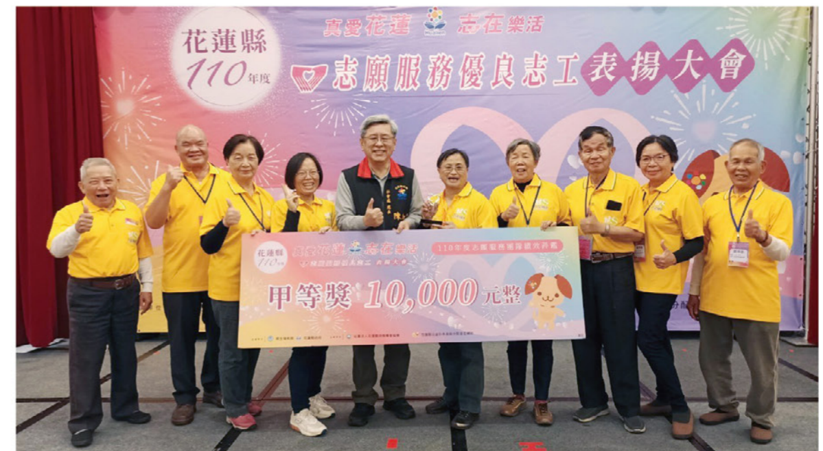
芥菜種會榮獲110年度志願服務評鑑績優團隊甲等獎

5月中旬因疫情三級警戒，導致全國各關懷據點皆休站。在嚴峻的疫情之下，需為長者量身打造應變的服務，如疫苗接種預約服務、每天電話關懷、預備防疫物資包、居家作業、運動教材（彈力帶、彈力球）、線上直播課程、3C手機教學等。目的就是為了讓長輩能安心在家做好防疫，雖受空間的限制，但我們的服務持續不中斷，讓長輩身心靈得到全面的照顧。