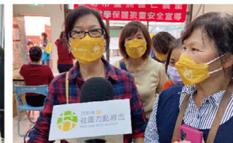
左/前往文山社區大學與公民記者社團交流學習 右/《社區力點線面》的社區記者培力課程帶領學員進行實戰演練