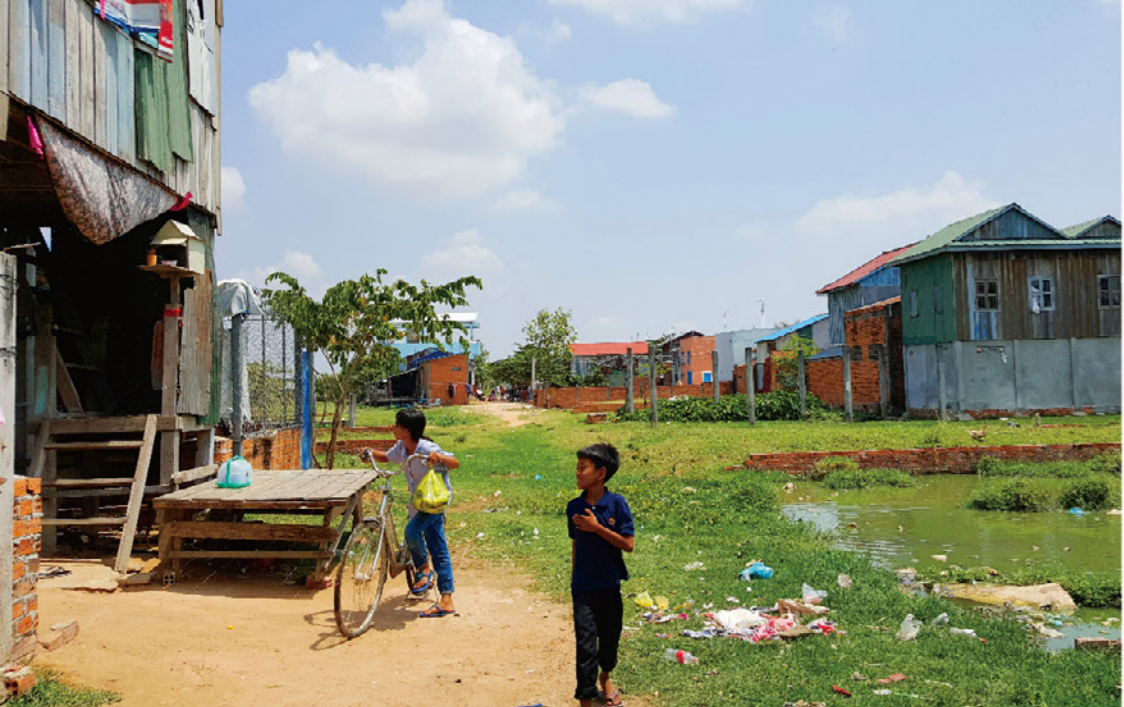
左/2018年造訪Trapeang AnhChanh社區，評估當地居住環境及孩童就學情形