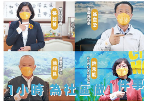
縣市政府呼籲【CIVIC HOUR 一小時為社區做一件事】

你是否願意為社區做一件好事？芥菜種會於2021年12月舉辦第三屆「芥助網鄰舍節」，透過實體與線上內容包含共享櫥櫃、愛心店家、超人里長等184場活動，共有18個縣市、114個合作單位，超過5,000人次參與，促進社區居民交流；此外也提出呼籲【CIVIC HOUR 一小時為社區做一件事】，苗栗縣徐耀昌縣長、雲林縣張麗善縣長、嘉義縣翁章梁縣長、新北市社會局許秀能副局長，以及蕭敬騰、小宇、李玉璽、黃瓏寧醫師、田知學醫師、許書華醫師等23位名人均同聲響應。