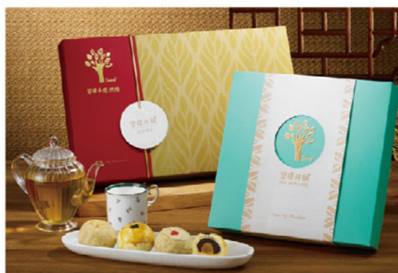
左/習得米月餅以最適比例的台灣好米取代麵粉，製成口感清爽香鬆不甜膩的米月餅 右/習藝所青銀共創，結合青年及長者攜手烘焙

未來習得手感烘焙更將持續研發製作，以更在地、永續的食材，將更多健康美味的好食物帶到大家面前。發展在地、永續、安心、無負擔的習得手作品牌。習藝所的藍天綠地，也將持續成為服務長者、培力青年，實踐熟齡價值的場域。NS