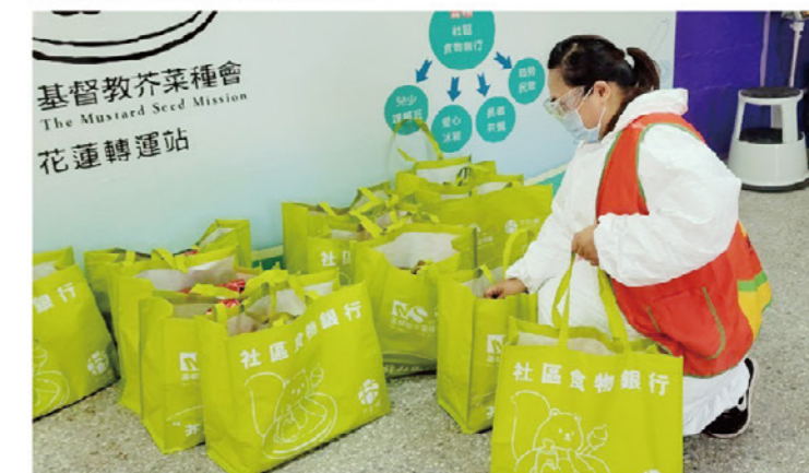
食物銀行與社區防救災工作結合

去年起我們更加關注社區面對災害時的備災議題，因此將食物銀行與社區防救災工作結合，並於全台4個易受災且成為孤島之部落（新竹尖石鄉、南投仁愛鄉、台東海端鄉、台東蘭嶼鄉）合作，除了推展社區居民在汛期時儲糧觀念以外，更成立社區備災儲糧點，若天災發生部落聯外交通完全中斷，居民無法外出且資源也無法進入時，能夠即時將儲糧點物資提供給社區中有需要的家庭，至少能夠渡過3天艱困的時刻。