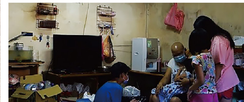
左/社工前往部落危險的道路 右上/社區物資包發放並即時提供至收容所 右下/社工訪視案家家庭狀況