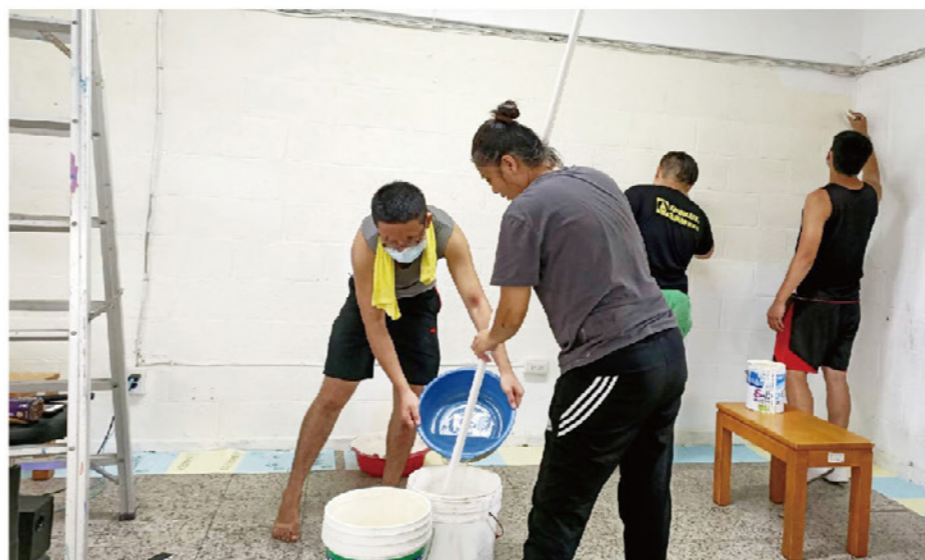
左 / 少年之家院生學習居家修繕，體驗職人生活 下 / 少年之家院生製作竹筒飯