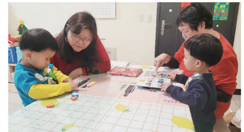
類家庭的支援照顧者陪伴早療兒童一起讀繪本

特殊兒童即使經由類家庭的照顧遠離受暴不安全的環境，仍會出現創傷反應、自我無價值感、情緒困擾、對未來較悲觀、被動等狀況。這些弱勢的孩子需要更多復育的工程，引導孩子們重新逐步建構自我價值感及找回成功經驗。展望新的一年期盼有更多的療育資源投入類家庭照顧，一起守護弱小的孩子們在社區中成長與發展。