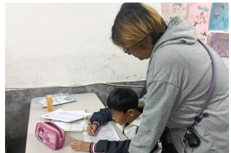
(左) 芥菜種會在社子島「三三號跨界福音工作站」據點合作佈建「社子島助人網」，孩子放學到安全的課輔照顧據點。