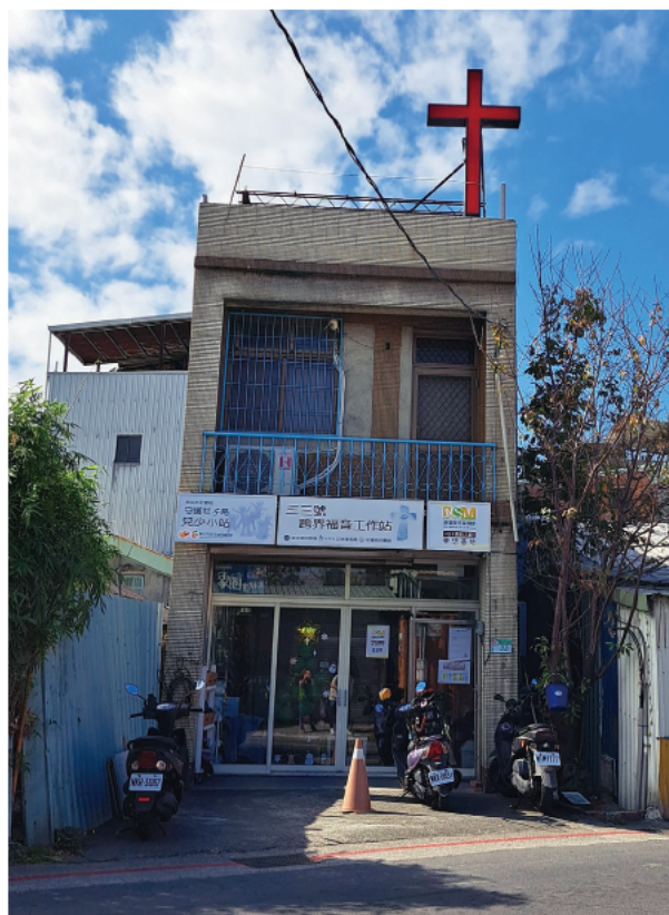
跨界 33 據點外觀照

這裡的人們穿過稻田，經過斑駁的鐵皮屋頂，腳步聲回蕩在潮濕的巷弄裡。早晨的淡水河邊，老人佝僂著身子，細細挑選漁網裡殘留的小魚，彷彿要從河流的手心裡撿回一點往日的餘溫；中午，富安國小的孩子們結伴而行，手指上的粉筆灰訴說著課堂的漫長；夜晚降臨，昏黃的燈光灑在路面，像為這座島的靜謐披上了一層薄紗，連時間都似乎屏住了呼吸。